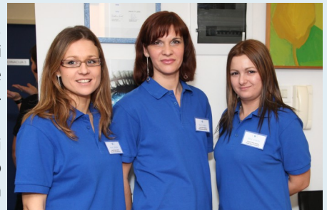
medicinske sestre u Poliklinici Bilić Vision

Ponosimo se iskustvom i znanjem naših liječnika kao i tehnologijom koju imaju rijetke medicinske ustanove u Hrvatskoj.